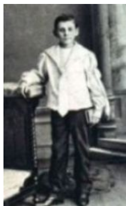
1ère communion, 18 mai 1905