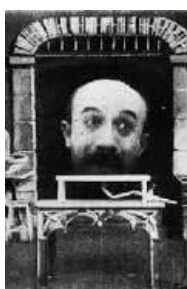
L'Homme à la tête de caoutchouc