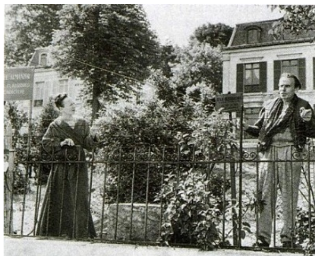
LE MAIRE de MEUDON REAGIT

Soyons optimistes, peut-être qu'ils y finiront, tous. "